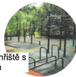
Sportovní hřiště s workoutem