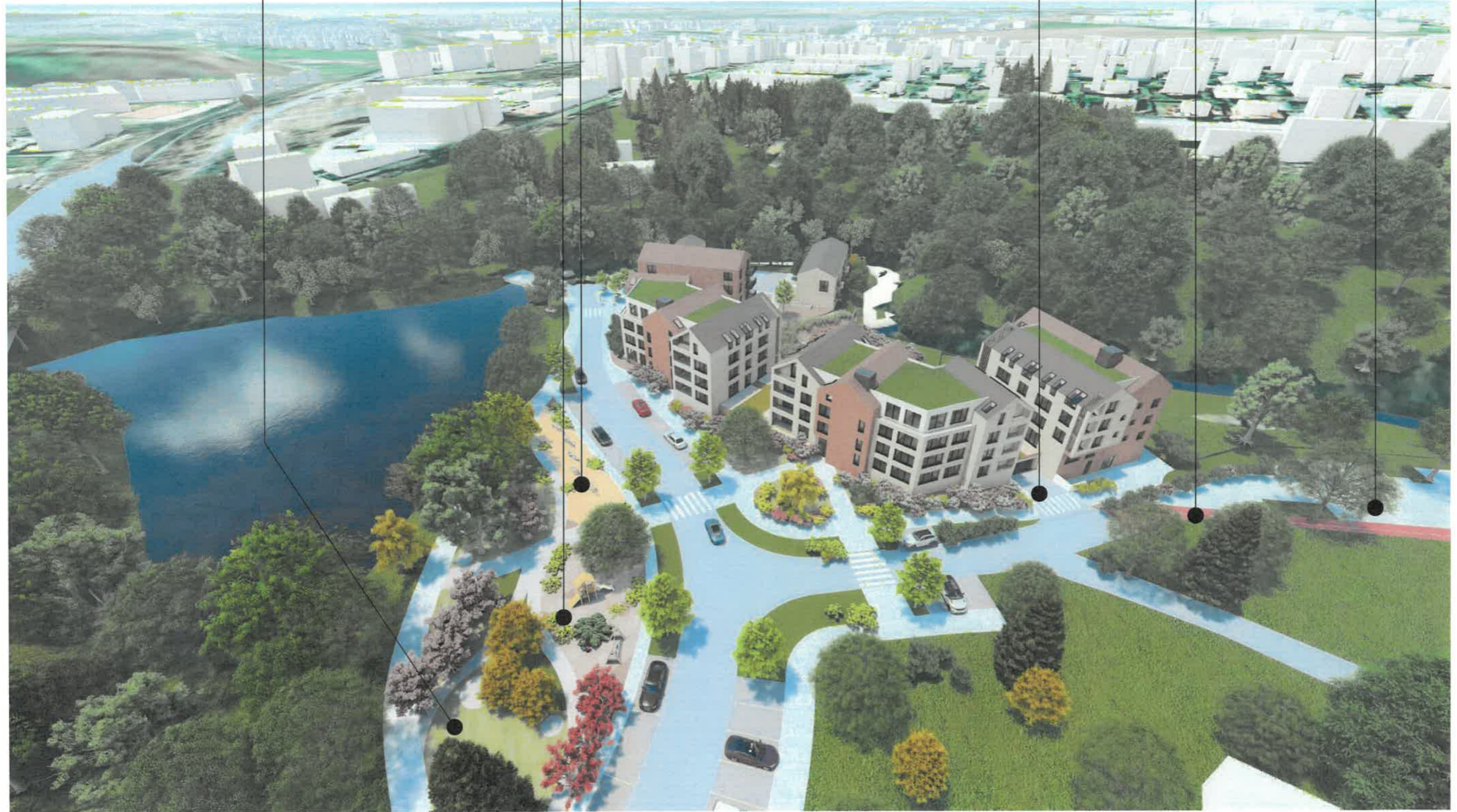
Revitalizace betonových panelů na park