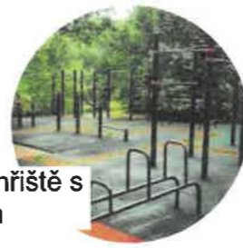
Sportovní hřiště s workoutem