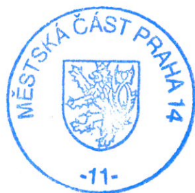
Ing. Markéta Adámková vedoucí odboru dopravy a ochrany prostředí

Podle § 77 odst. 5 zákona č. 361/2000 Sb., opatření obecné povahy nabývá účinnosti pátým dnem po dni vyvěšení veřejné vyhlášky. Podle § 173 odst. 2 zákona č. 500/2004 Sb. proti opatření obecné povahy nelze podat řádný opravný prostředek. Návrh na zrušení opatření obecné povahy je možno podat podle § 101a a 101b zákona č. 150/2002 Sb., soudní řád správní, ve znění pozdějších předpisů.